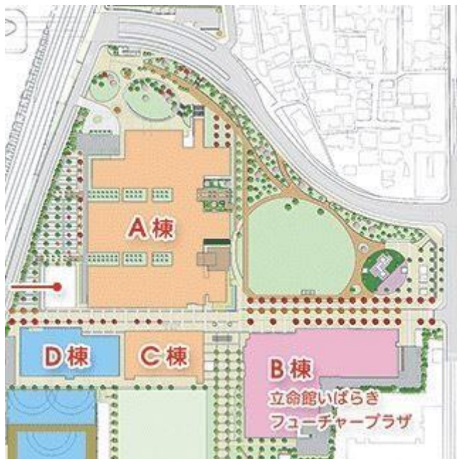
立命館茨木フューチャープラザ周辺図